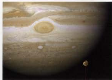
• Júpiter amb lluna