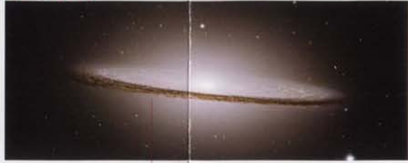
• galàxia del barret M/104