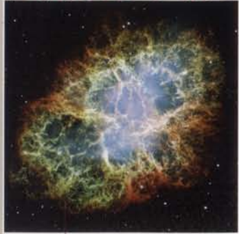
• nebulosa del cranc