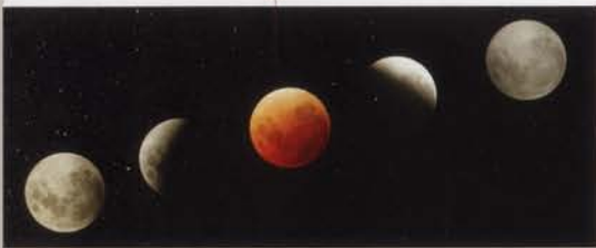
• eclipsi de lluna