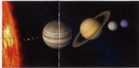
• sistema solar