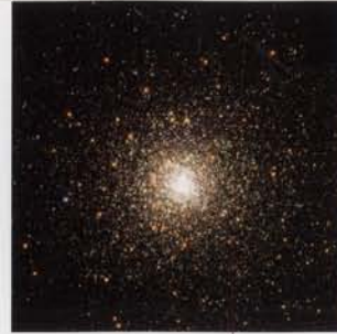
• cúmulo globular estel·lar